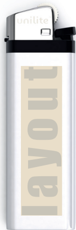
Reibrad - Feuerzeug