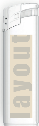
Elektro - Feuerzeug